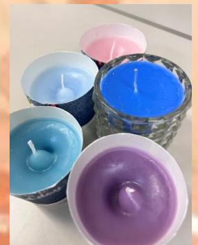
12月はキャンドル作りイベントを開催しました

※お店での外食や外出イベントに関しては、感染状況によって、中止や変更になる場合もございます